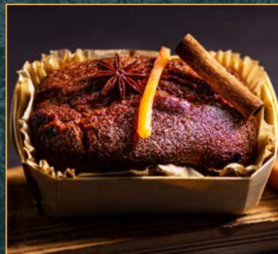
Pain d'épices - 5,50€ Miel du rucher de la colline, épices

Et encore plus de variétés à découvrir en boutiques!