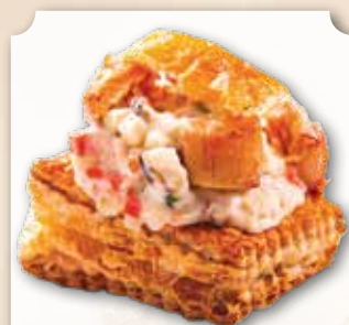
Bouchée Saint-Jacques 4,15€ la pièce Saint-Jacques poêlées, crevettes, petits légumes et sauce blanche