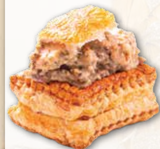
Bouchée Ris de Veaux 4,15€ la pièce Riz de veau fondant, champignons et quenelles de veau, sauce blanche, vol au vent