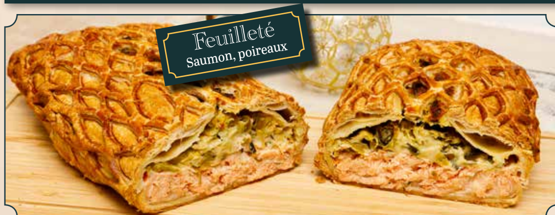
Feuilleté Saumon, poireaux