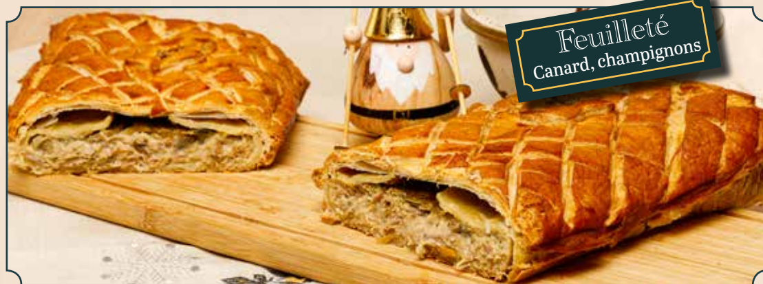
Feuilleté Canard, champignons